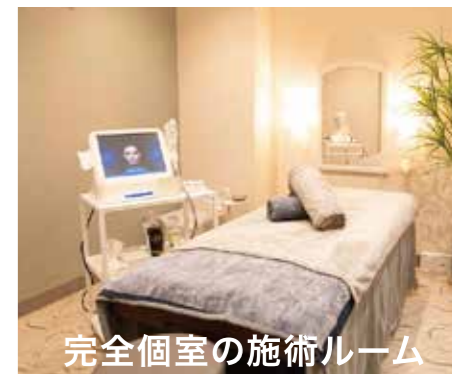
完全個室の施術ルーム