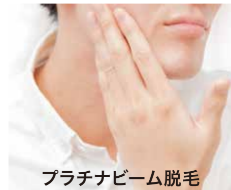
プラチナビーム脱毛