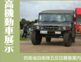
防衛省自衛隊五反田募集案内所